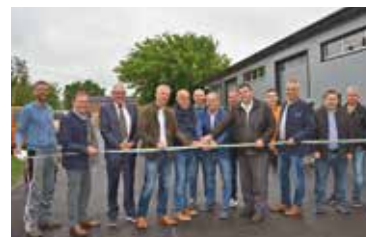
Bauhof Hadres eröffnet