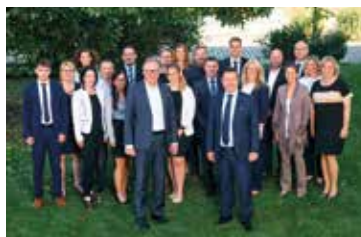
150 Jahre Sparkasse Haugsdorf