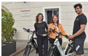
E-Bike Verleih im Pulkautal

„O'zapft is!" im Festzelt der FF Mailberg